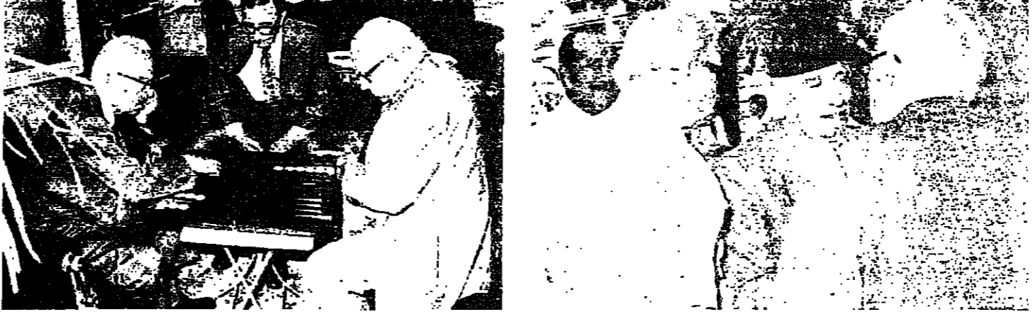
مباراة في طولة الزهر بين الرئيس فزجييه والنائب الخليل ، تحت رقابة السيد يوسف ساسين .

علق على اللقاء بقوله : اجمل ما في هذه المحادثات انها تساهم على خلق الاجواء التي تتيح تساهم على التقدم في طريق الوفاق السياسي الذي اصبحت اليلة تحتاج اليه يوما بعد يوم ، والحديث عن الحكومة الجديدة سابق لوانه ، ومن العجل والاصناف ان نمضي لهذه الحكومة فرصة العمل لاستكمال ما بدأت به وهو بحق يعد اجازة كبرى .